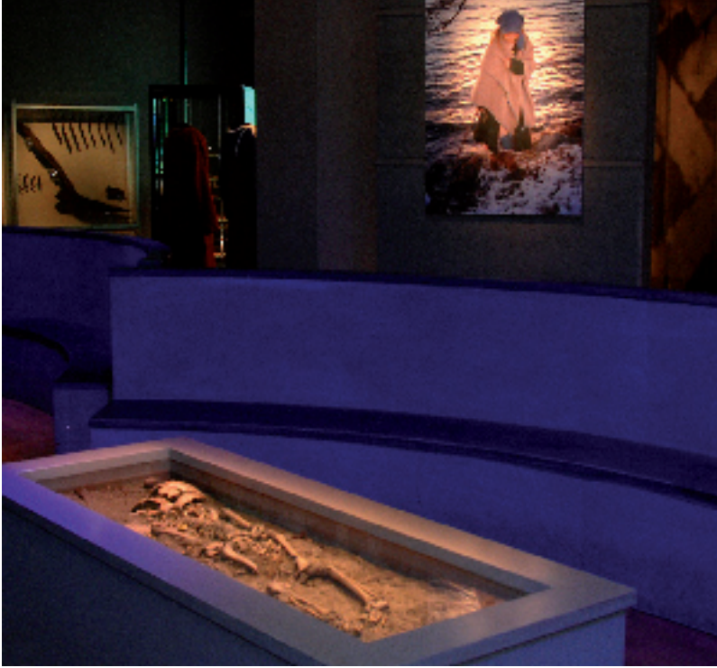
»Monter J1. Birkaflickan.