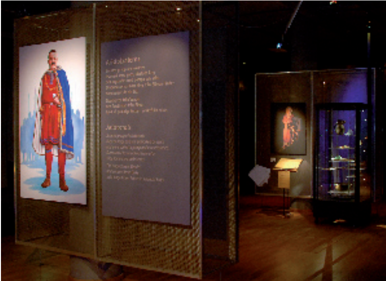
»Godsherren från Vendel till vänster och Birkafurstinnans monter till höger.