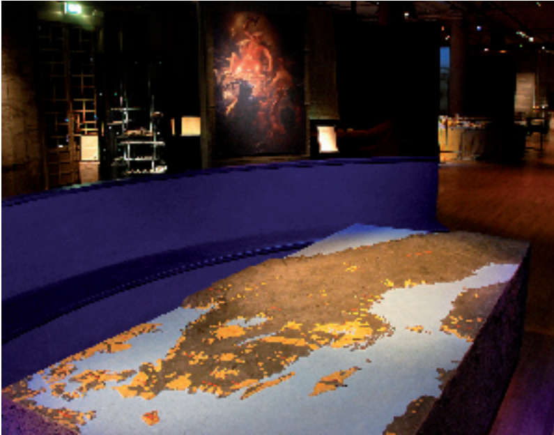
»Monter L. Länderna innan Sverige.

namn på mindre geografiska delar. Vilka värdegrundsfrågor skulle kunna belysas här?